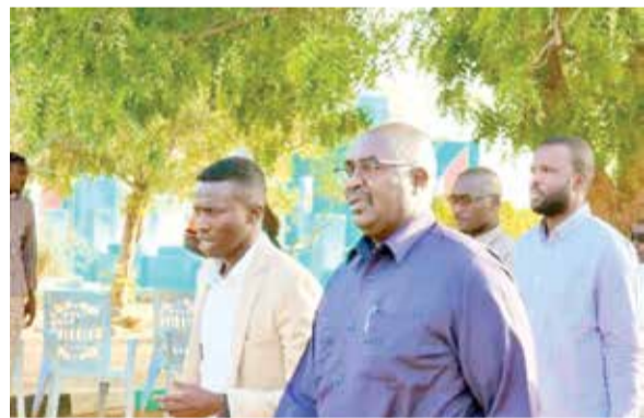
والجيش يتهم الدعم السريع بالحادثة

واعترفت الحركة ما يجري في الجنيبة "كارثة حقيقية وإبادة شاملة طالت المدنيين"، مشيرة إلى أن "اغتيال والي وما يجري من عمليات قتل ممنهجة